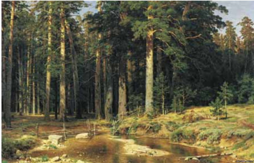
Сочинение по картине И. Шишкина «Сосны, освещенные солнцем».

Учимся писать сочинение по картине, ведь у этого жанра свои законы: обязательно нужно поэтапно рассматривать передний, центральный и задний планы. Необходимо в ткань сочинения вплести средства выразительности языка: эпитеты, метафоры, сравнения, олицетворение. Почитайте, что у нас получается.