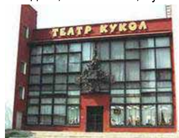
Театр Образцова в Москве

Самый первый театр, в который попадают маленькие дети, конечно же, кукольный. На сегодняшний день