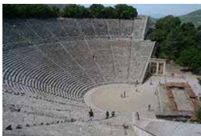
Театр Древней Греции

Ни один человек не знает, когда же возник первый кукольный театр. Однако из одного поколения в другое передаются две легенды, повествующие о появлении этих театров.