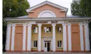
Ульяновский театр юного зрителя

Идея создания детского театра начала обсуждаться в середине XVIII века. но сами представления для детей появились лишь в XIX веке.